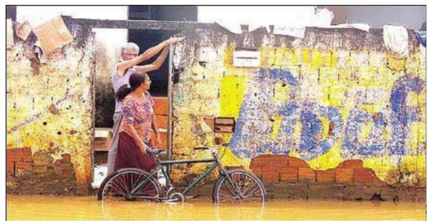
O POPULAR, Goiânia, 29 mar. 2005, p.1. Capa. [Adaptado].

A imagem expressa uma situação que evidencia a ocorrência de um impacto ambiental negativo. Esse impacto tem origem